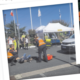
Mise en situation accident à Joué-les-Tours (37)