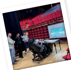
Simulateur à Bourges (18)