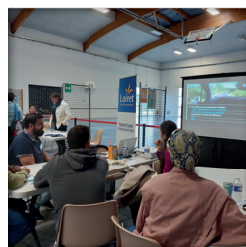
Mise à niveau code de la route à Gidy (45)