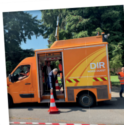
Mise en situation dépôt de plots à Sours (28)