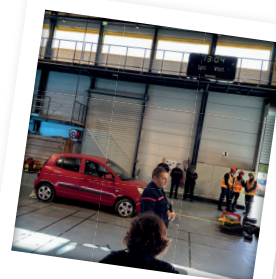
Dés-incarcération à Issoudun (36)