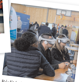
Réalité virtuelle à Blois (41)