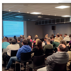
Conférence à Joué-les-Tours (37)