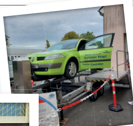
Voiture Tonneau à Gidy (45)