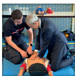
Massage cardiaque à Sours (28)