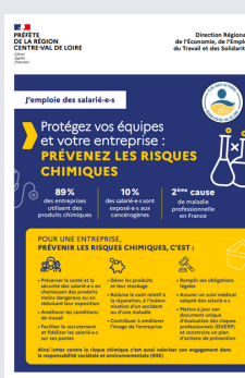
RISQUE CHIMIQUE PLAQUETTE EMPLOYEURS