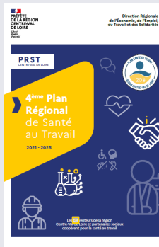
BROCHURE DU PRST4