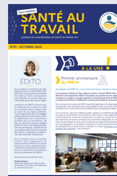
JOURNAL DU PRST4