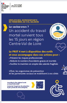
AFFICHE DU PRST4