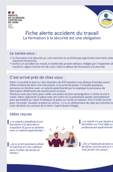
FICHES ACCIDENTS GRAVES ET MORTELS