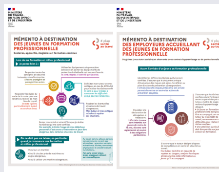
SÉCURITÉ DES JEUNES 2 MEMENTOS