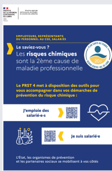
RISQUE CHIMIQUE AFFICHE