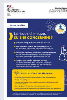
RISQUE CHIMIQUE PLAQUETTE SALARIES